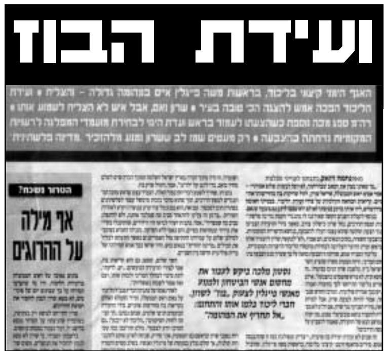
"ידיעות אחרונות" 09.06.2003

אנו זקוקים למתנדבים בכל התחומים - התקשרו אלי (064-202884) והשתבצו לפעילות במסגרת אחת מוועדות הפעולה, או באופן עצמאי.