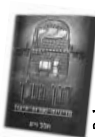
דרך המלך סיפרו של הלל ויס