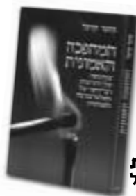
המהפכה האמונית סיפרו של מוטי קרפל

(*) לכל הפעילויות הרבות הללו שותפים עוד רבים וטובים בכל תחומי העשייה. עם האנשים היקרים שאת שמותיהם נאלצנו להשמיט בשל קוצר היריעה, הסליחה.