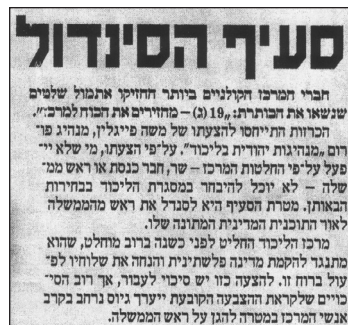
"ידיעות אחרונות", יום ג' י"ב בטבת תשס"ד (6.1.10)