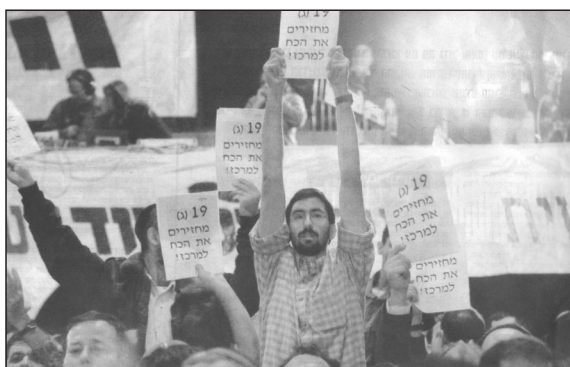
"ידיעות אחרונות", יום ג' י"ב בטבת תשס"ד (6.1.10)

בסוף שנת תשס"ד מתברר ש"רק הליכוד יכול". הליכוד כתנועה הנכנעת לראש ממשלה המתנהג כדיקטטור יכולה לגרש יהודים מבתים ולהרוס כל חלקה טובה, והליכוד כתנועה הנאמנה לערכיה היא היחידה המסוגלת גם לעצור אותו. כאשר מאפשרים לתנועה לומר את דברה, כאשר עוזרים ומאפשרים לחברים להתארגן, הנאמנות לערכים גוברת. מטרתנו הראשית היא לחזק מגמה זו ולהביאה לידי ביטוי בהנהגת תנועת הליכוד ובהנהגת עם ישראל. לכל ברור כי בלי הקולות של 'מנהיגות יהודית' היתה הצעת שרון עוברת, ומלאכת העקירה היתה קלה עליו עשרת מונים. במפלגת העבודה מתחיל 'מרד' נגד פרס, בדרישה להפסיק את המשא ומתן לכניסה לממשלה. לא רבים זוכרים תמיד את ההקשר, אך המציאות הישראלית כולה מושפעת ישירות ממהלכה של תנועת 'מנהיגות יהודית'. בסיום תשס"ד יכול כל חבר שהצטרף לתנועה להודות לבורא עולם על שניתן לו לפעול ולהשפיע בצורה אפקטיבית כל כך על גורלו של עם ישראל.