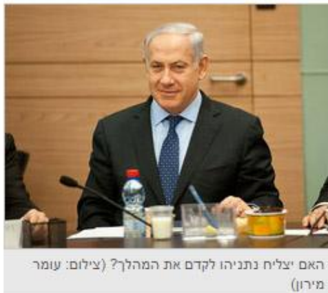
האם יצליח נתניהו לקדם את המהלך?

נתניהו נגד המתנחלים במפלגתו? במטרה לבלום את כוחם המתגבר של המתנחלים במפלגתו, ראש הממשלה שואף להגדיל את מרכז הליכוד, אך להוסיף רק נציגים מהערים - כך לפי ההערכות. בדיון שקיים שלשום (ראשון) נתניהו עם ראשי מוסדות המפלגה, הוחלט לכנס ישיבה של ועדת החוקה של הליכוד ביום רביעי הקרוב, זאת בכדי לשנות סעיף בחוקת המפלגה, שמשמעותו - הגדלת מספר חברי המרכז מהערים ב-30% (כ-400 חברי מרכז - 1.9), בעוד שמספר החברים במועצות האזוריות, ובכלל זה ההתנחלויות, יישאר ללא שינוי.